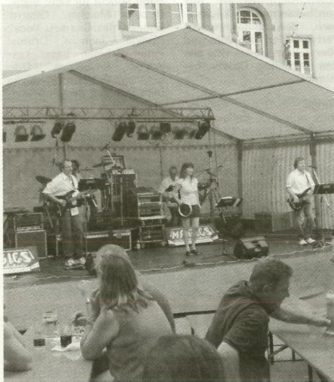
Die „MAGICS“ bieten Tanz-, Unterhaltungs-, und Stimmungsmusik für jeden Geschmack und jedes Alter.